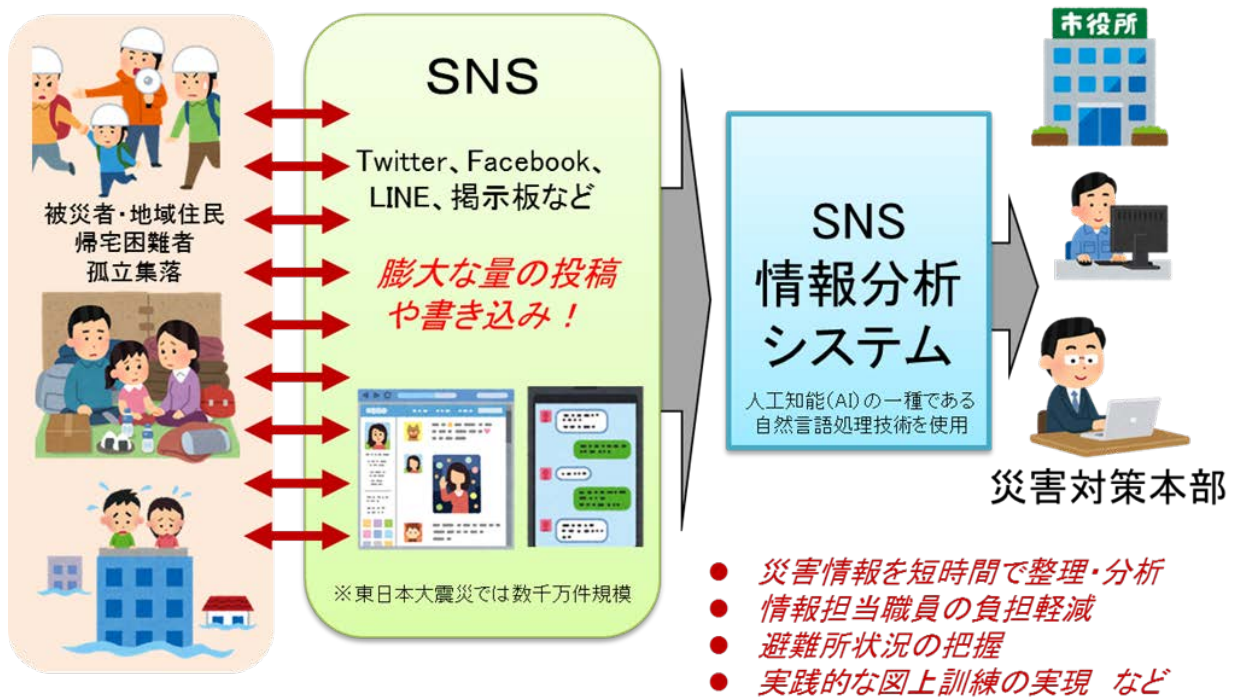
図 SNS 情報分析システムのイメージ