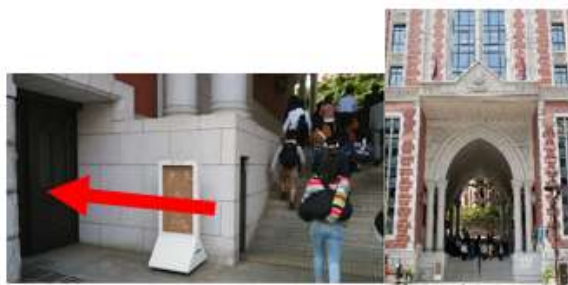
三田通り（東門）から来られる場合は、この入り口。