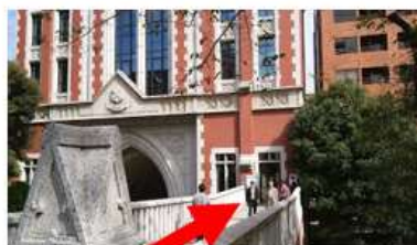
正門（南門）から来られる場合は、この入り口。